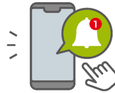
お届け完了通知が届く