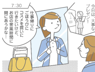
（ご利用想定シーン①）